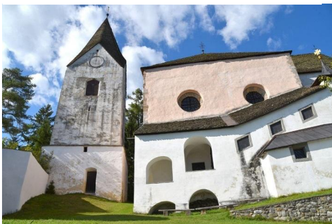
Slika 2: Cerkev sv. Pankracija

https://www.geago.si/sl/pois/21992/cerkev-sv-pankracija-