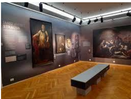
Slika 10: razstava slikarjev Strauss

https://www.kpm.si/razstave/strauss-pinxit-po-poteh-slovenjgraskih-barocnih-slikarjev-straussov/