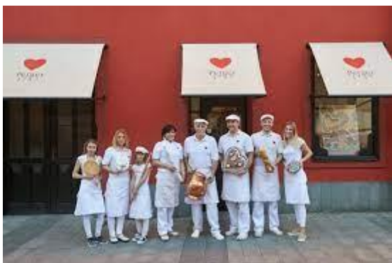
Slika 9: Družina Perger pred trgovino