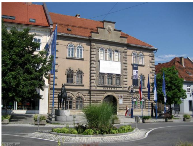
Slika 3: Glavni trg Slovenj Gradec

https://krajji.eu/slovenija/slovenj_gradec_staro_mestno_jedro_glavni_trg/slo