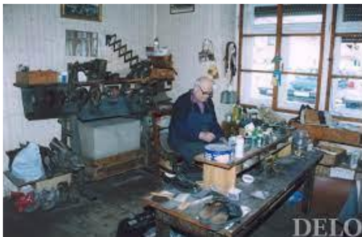
Slika 6: Čevljarstvo Levovnik

https://www.delo.si/razno/za-par-cevljev-so-potrebovali-osem-ur/#!