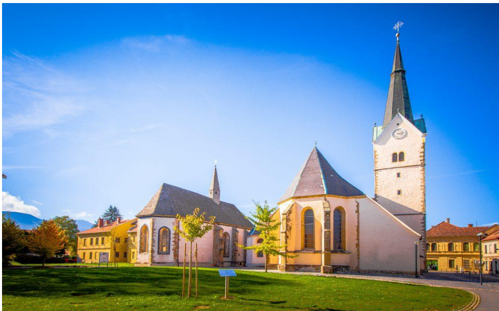
Slika 4: Cerkvi sv. Elizabete (desno) in sv. Duha (levo)

https://www.zgodovinska-mesta.si/mesta/slovenj-gradec/