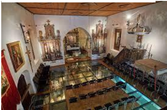
Slika 1: Notranjost cerkve sv. Jurija

https://www.kpm.si/dokumenti/kpmsg-cerkve/11-sv-jurij.html