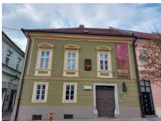
Slika 8: Rojstna hiša Huga Wolfa

https://www.kpm.si/razstave/rojstna-hisa-huga-wolfa-mednarodni-informacijsko-dokumentacijski-center-huga-wolfa/