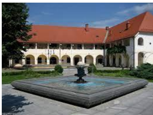
Slika 7: Rothenthurn

https://krajie.eu/slovenija/slovenj_gradec_grascina_rotenturn/slo