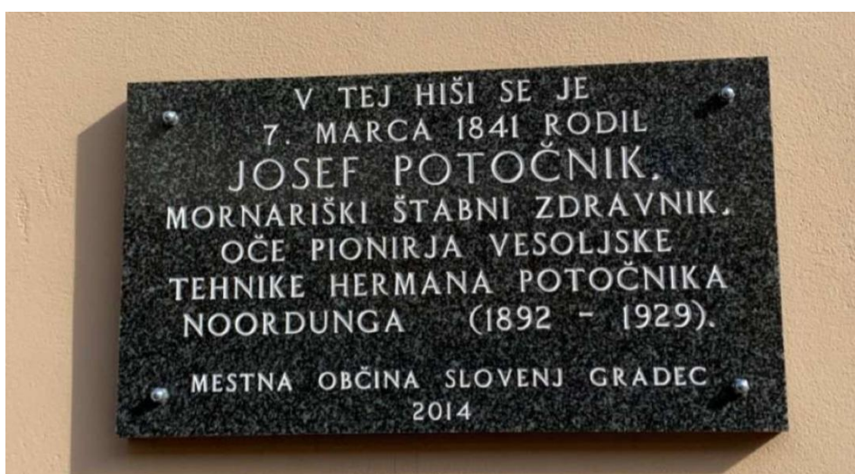
Slika 11: Rojstna hiša očeta Noordunga

https://www.kpm.si/razstave/strauss-pinxit-po-poteh-slovenjgraskih-barocnih-slikarjev-straussov/