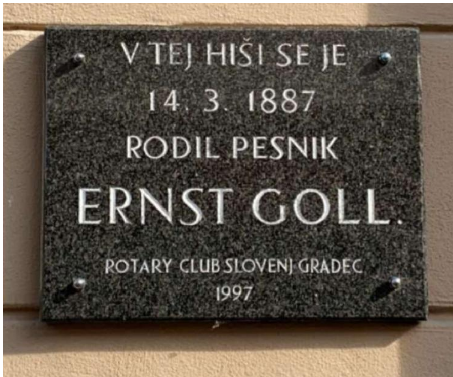
Slika 12: Rojsna hiša Ernsta Golla